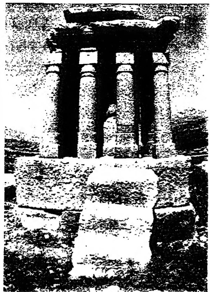
المسجد الذي في قلعة قفرا